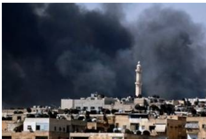
Рис.1. Загрязнение окружающей среды